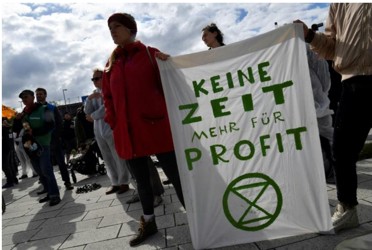
Des militants portent une bannière où on lit "Plus de temps pour les profits" pendant une manifestation contre le géant automobile allemand Volkswagen (VW), qui tenait son assemblée générale le 14 mai 2019 à Berlin

Ces mobilisations éclipsent d'autres méthodes plus techniques, comme l'achat d'actions, donnant le droit de poser des questions aux directions lors des assemblées générales des multinationales, voire d'espérer peser sur certaines décisions.