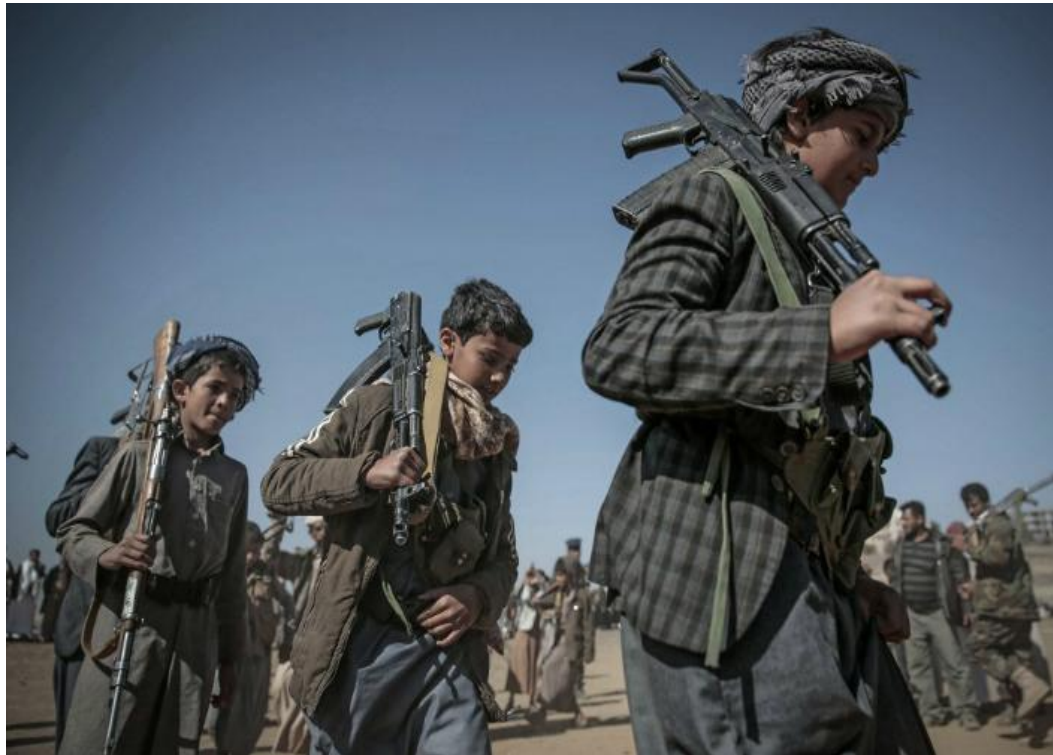
Des armes françaises, vendues à l'Arabie Saoudite, ont été retrouvées sur le terrain de la guerre civile au Yémen.

Les États-Unis s'arment face à la menace chinoise, l'Inde face au Pakistan, la Corée du Sud face à son voisin du Nord... Sans compter les conflits civils et les menaces djihadistes. De plus en plus d'armes circulent et le seul traité multilatéral existant a une efficacité très limitée. Certains investisseurs veulent calmer cette fièvre. Mais le mouvement n'en est qu'à ses débuts.